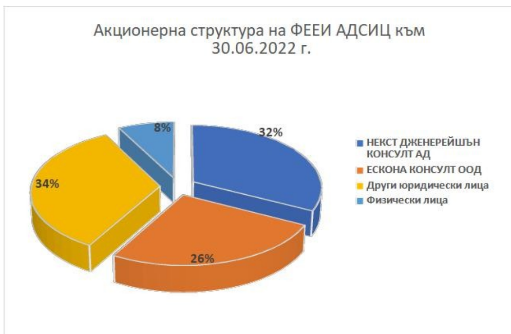
Акционерна структура на „ФЕЕИ“ АДСИЦ към 30.06.2022 г.