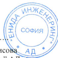
Бориска Борисова ” Енида Инженеринг” АД